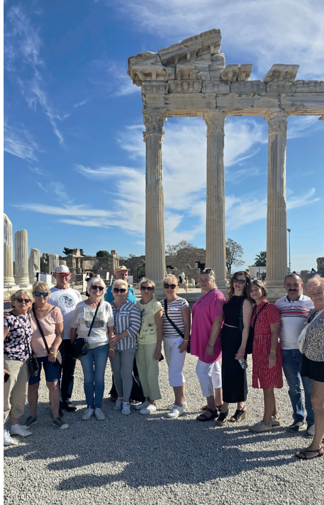
Mobilność w Turcji, UTW Zawiercie i UTW Siewierz