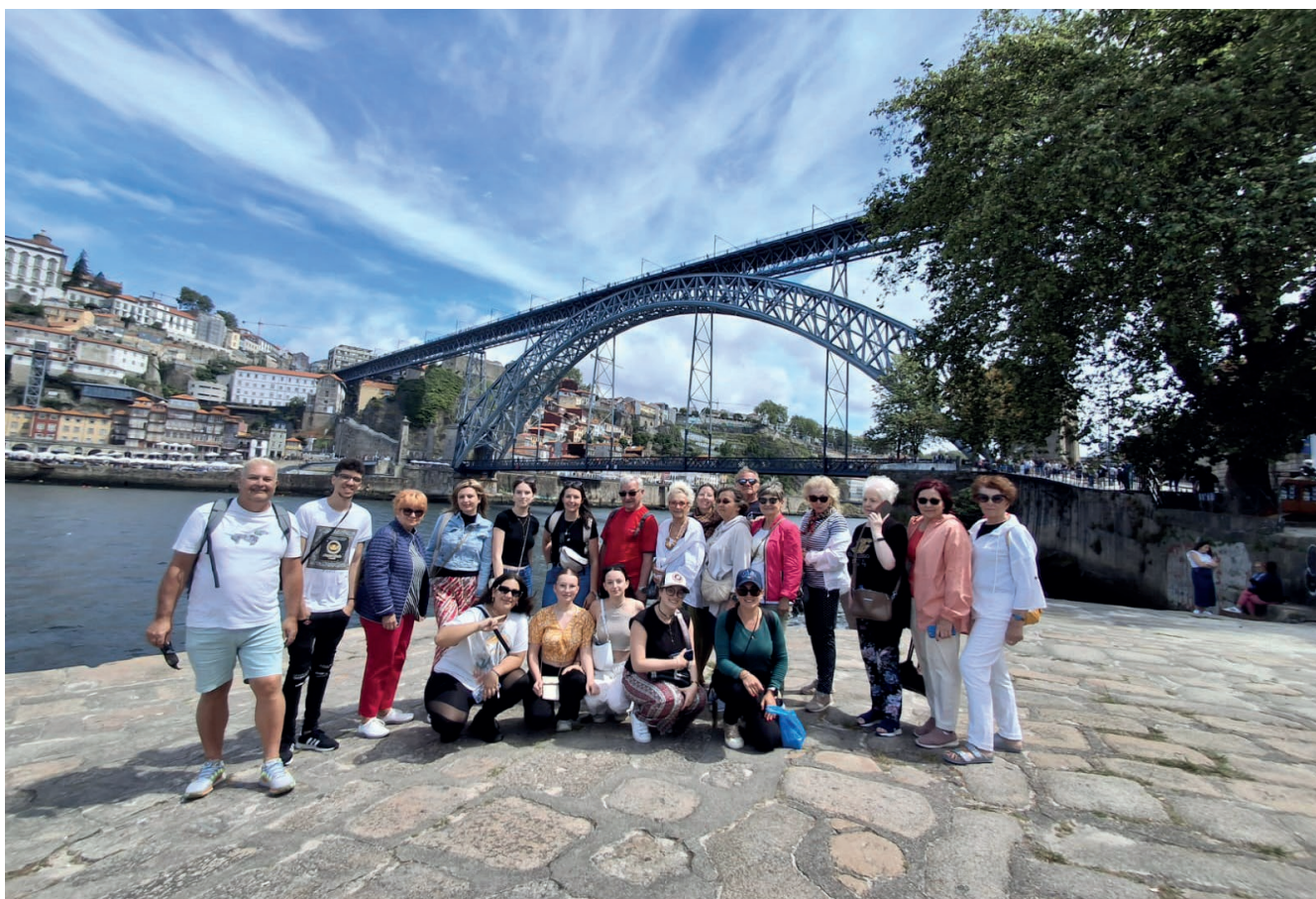
Mobilność w Portugalii

Portugalia jest krajem o bogatej historii, tradycjach i kulturze. Znajdujące się w jej północnej części miasto Barcelos, stało się przystankiem dla członków Zawierciańskiego Uniwersytetu Trzeciego Wieku, biorących udział w kursie pn. „Edukacja na świeżym powietrzu z elementami kreatywności” w ramach Programu Erasmus+. Działanie umożliwiło uczestnikom nie tylko zwiększyć wiedzę w zakresie tematu przewodniego, ale także stało się okazją do wzmocnienia kompetencji językowych, społecznych i międzykulturowych.