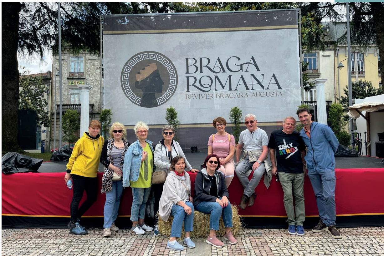
Mobilność w Portugalii

Outdoor activities , czyli aktywności na zewnątrz stanowią wszelkiego rodzaju aktywności o charakterze fizycznym, wykonywane na świeżym powietrzu. W tym zakresie można wskazać m.in. na rekreację, sport, trening czy też turystykę, których celem jest poprawienie zdrowia i kondycji fizycznej przy jednoczesnym obcowaniu z naturą. Tego rodzaju aktywności mają szczególne znaczenie dla osób w wieku senioralnym, które przynależą do uniwersytetu trzeciego wieku, gdzie mają możliwość kształcenia, zdobywanie i rozszerzania swojej wiedzy w wielu dziedzinach. Edukacja na świeżym powietrzu może wpływać na redukcję stresu i sprzyjać zwiększeniu koncentracji. To świetna okazja do tego, aby nauczyć się współpracy i komunikacji w zespole, przy jednoczesnym zdobywaniu wiedzy. Ogromne