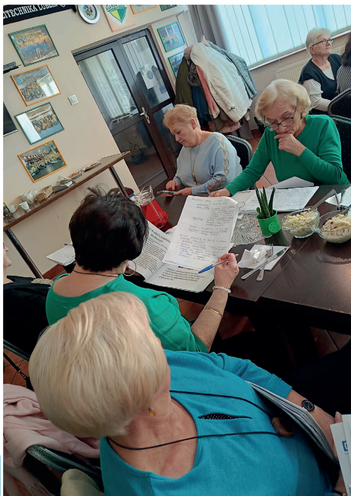
Warsztaty dotyczące tworzenia projektów

Logika zaprowadzi Cię z punktu A do punktu B. Wyobraźnia zaprowadzi Cię wszędzie. Wydaje się jednak, że te dwa obszary – logika i wyobraźnia nie wykluczają się wzajemnie, a ich połączenie jest szczególnie ważne podczas tworzenia projektów mających na celu rozwój danej organizacji czy społeczności lokalnej. Myślenie logiczne w kontekście projektu, pozwala na jego ustrukturyzowanie, wskazanie jaki problem chcemy rozwiązać, z czego on wynika, dlaczego jest to ważne i jakiego rodzaju działania można wdrożyć, aby osiągnąć cel. Nie mniejsze znaczenie ma tutaj też wyobraźnia, dzięki której możliwe jest poszukiwanie kreatywnych rozwiązań i nieszablonowych metod działania.