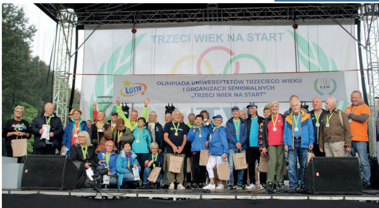
Olimpiada Seniorów – „Trzeci Wiek na Start”