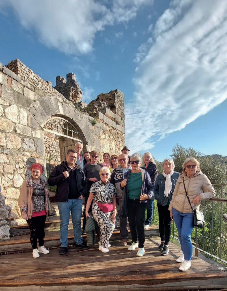
Mobilność w Turcji, UTW Łazy i UTW Siewierz

Teamwork jest pracą zespołową, która pozwala efektywnie koordynować działania grupy i osiągać wspólne cele. W trakcie kursu, uczestnicy skupili się m.in. na tym w jaki sposób wyznaczać role w zespole, aby możliwe było wzajemne dzielenie się wiedzą i osiąganie najlepszych rezultatów. Niezwykle ważnym aspektem było również opracowanie działań związanych z budowaniem więzi w zespole i organizacji oraz utrzymywaniem właściwych relacji między członkami stowarzyszenia. W pracy zespołowej kluczowe są komunikacja, jasne przekazywane informacje, budowanie poczucia jedności wokół wspólnych celów. Wzmacnianie produktywności organizacji poprzez teamwork stanowi jeden z kluczowych elementów osiągnięcia krótko- i długoterminowych sukcesów organizacji, a jedno jest pewne – Kozieglowski Uniwersytet Trzeciego Wieku patrzy dalekowzrocznie i długoterminowo!