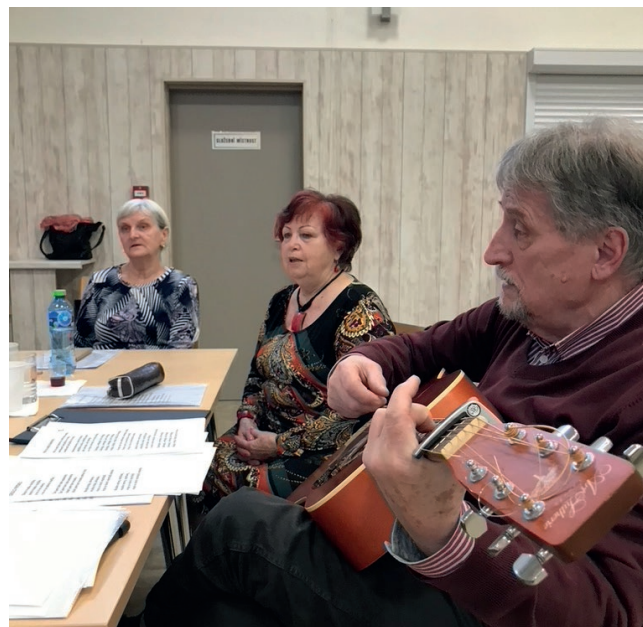
UTW Siewierz w Czechach

Międzynarodowe mobilności to także szansa na wzmacnianie kompetencji międzykulturowych,