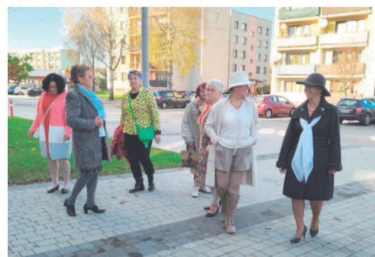
Aktywni mieszkańcy w akcji! / str. 7