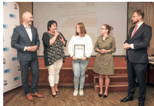
Zostańcie w Zawierciu / str. 3