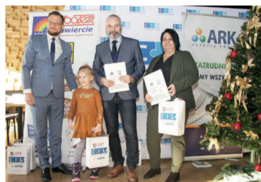
Bożonarodzeniowa Akcja Charytatywna / str. 2